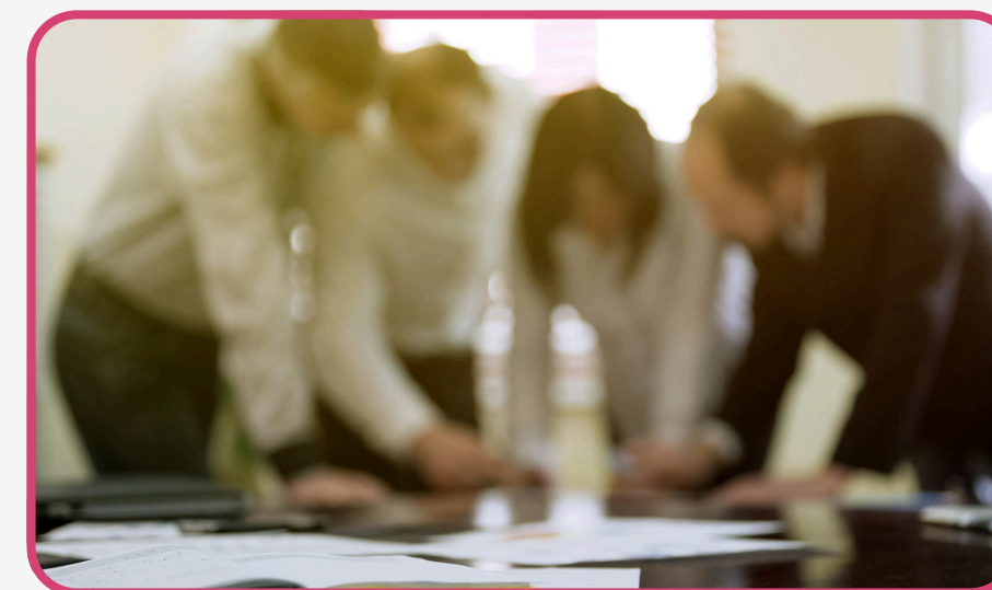
Fundamentos de la Gestión de Riesgos - Nivel I