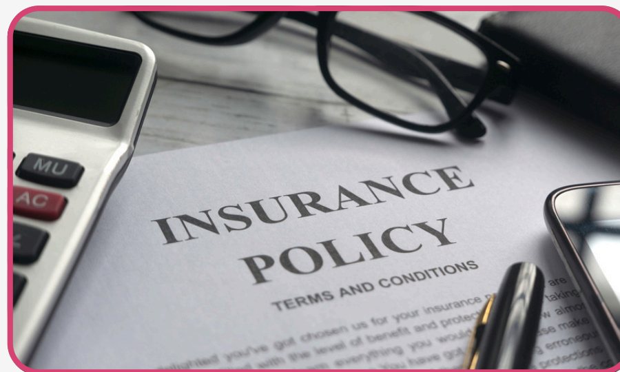
Daños en la Empresa