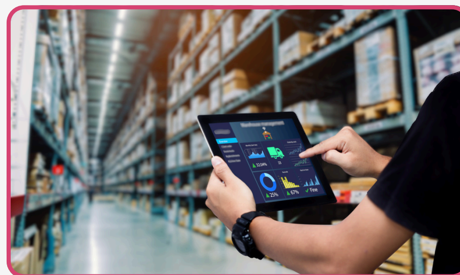
Verificación del riesgo