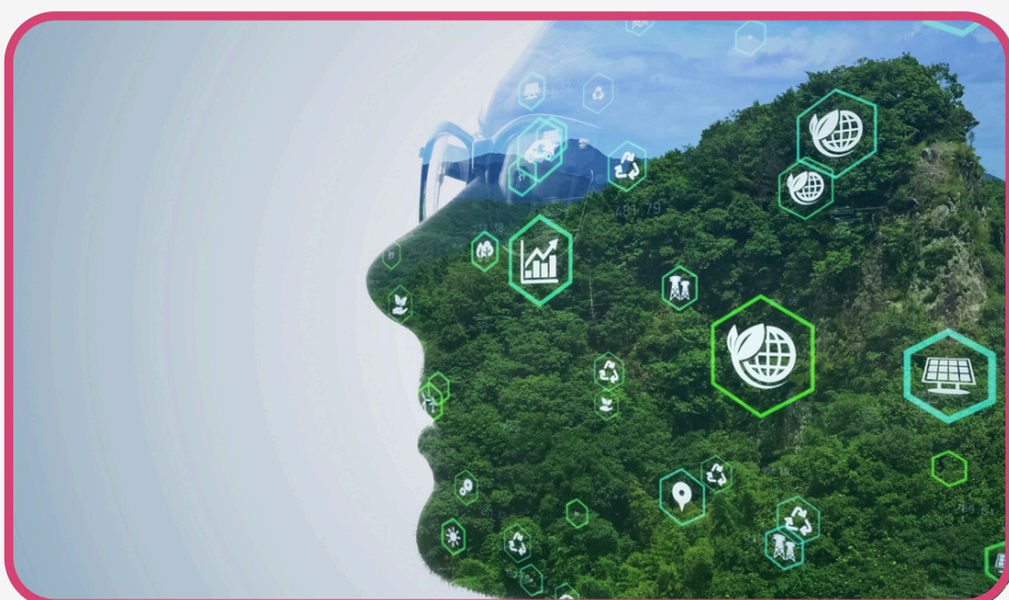
Riesgo Medioambiental y su Aseguramiento