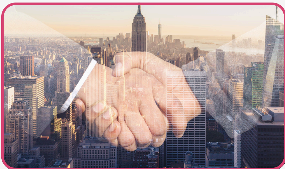
Fundamentos de la Responsabilidad Civil - Nivel iniciación