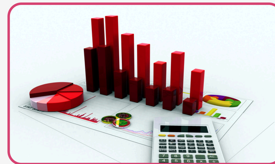
Cobertura de Pérdida de Beneficios